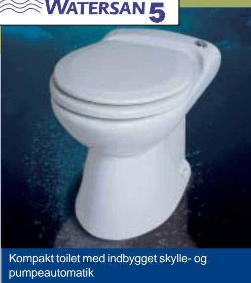
Kompakt toilet med indbygget skylle- og pumpeautomatik