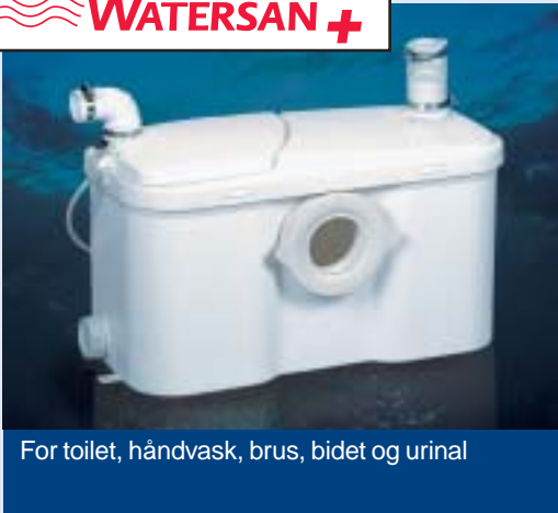
For toilet, håndvask, brus, bidet og urinal