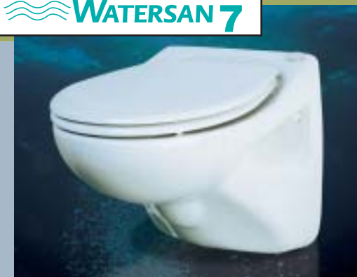
Kompakt toilet med indbygget skylle- og pumpeautomatik for vægmontage

Her i WATERSAN-huset kan du se alle mulighederne. Det er jo ofte således, at faldstammen ikke er placeret lige der, hvor du vil indrette ekstra faciliteter som toilet, bad eller køkken.