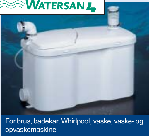
For brus, badekar, Whirlpool, vaske, vaske- og opvaskemaskine