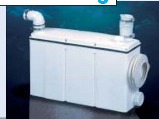
For væghængt toilet, håndvask og brus